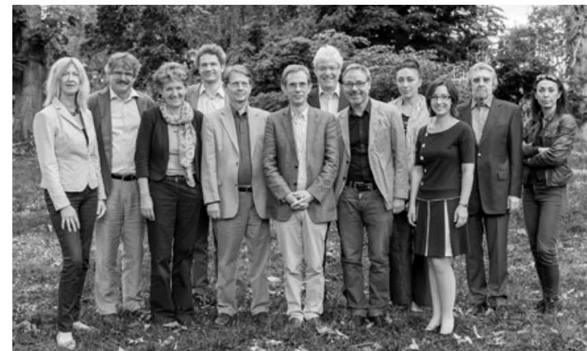
Rat für Kulturelle Bildung, 2014.

Professor für Historische Erziehungswissenschaft, Humboldt-Universität zu Berlin (bis 2011)