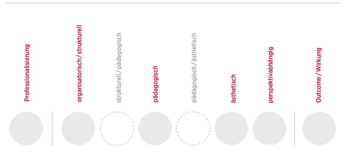
Schema zur Gruppierung der Qualitätsmerkmale

Eine fünfte Kategorie beschreibt die ‚Professionalisierung‘, also die Qualifizierung von Akteuren. Diese liegt genau wie die sechste Kategorie ‚Outcome/Wirkung‘ außerhalb des Prozessgeschehens.