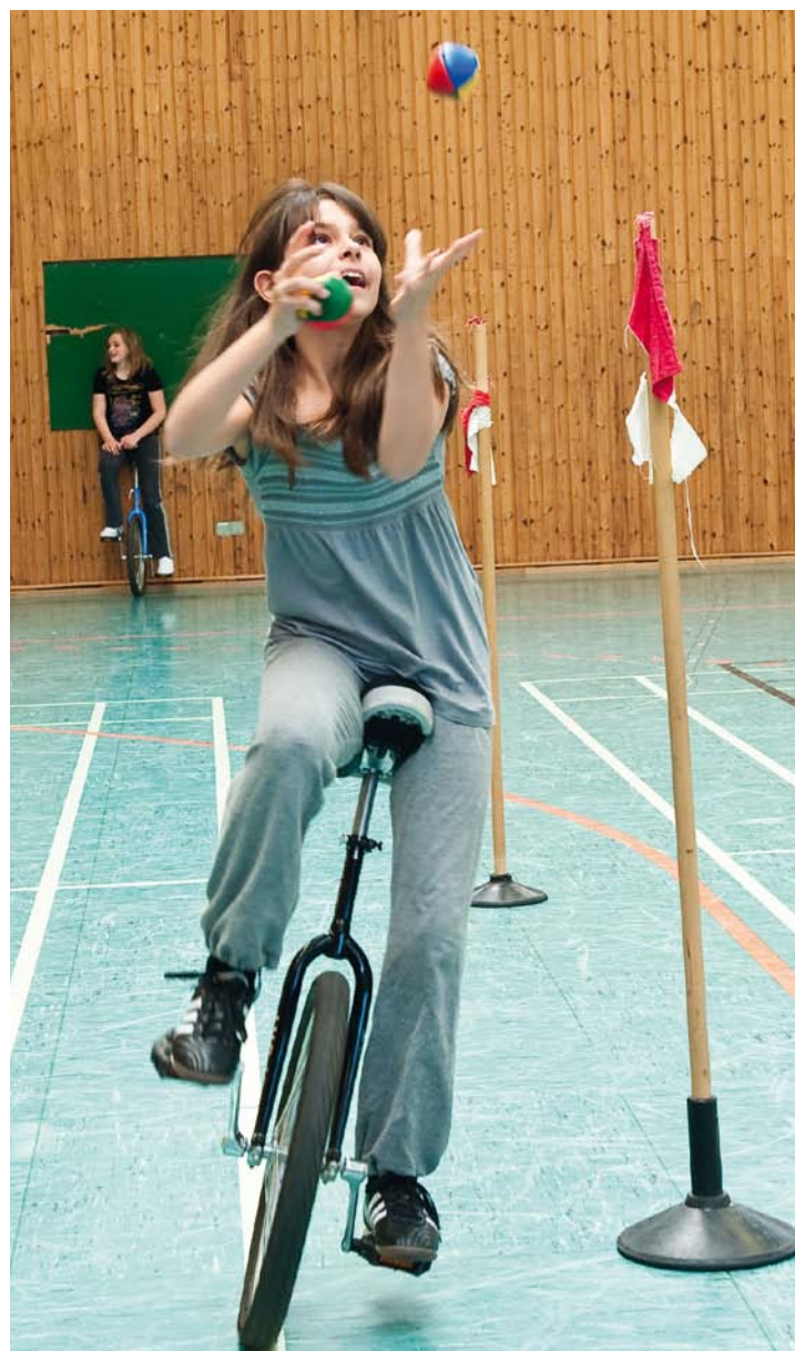
Zirkusatmosphäre: Schüler des Gymnasiums Essen-Überruhr beim Training in der Zirkus-AG.