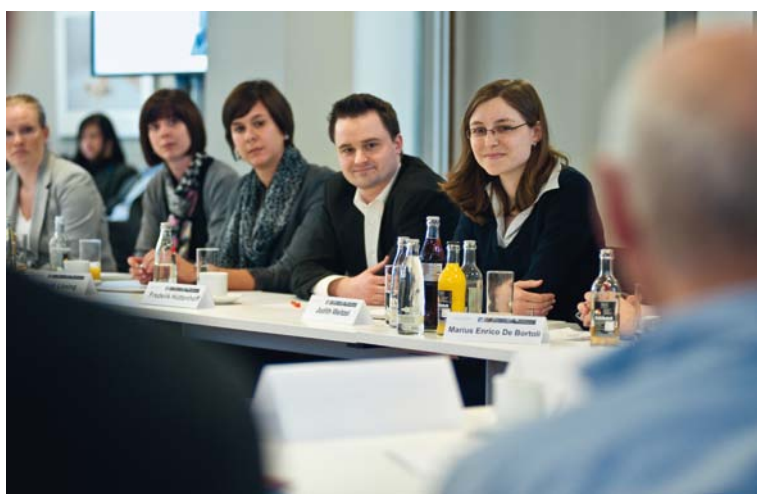
Studierende der NRW School of Governance beim Seminar von Gastprofessor Stefan Aust.