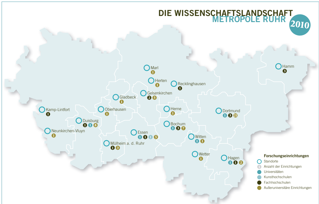
Eine Übersicht über die Vielfalt der Wissenschaftsregion Ruhr: sechs Universitäten, eine Kunsthochschule, 17 Fachhochschulen und 59 außeruniversitäre Forschungseinrichtungen.