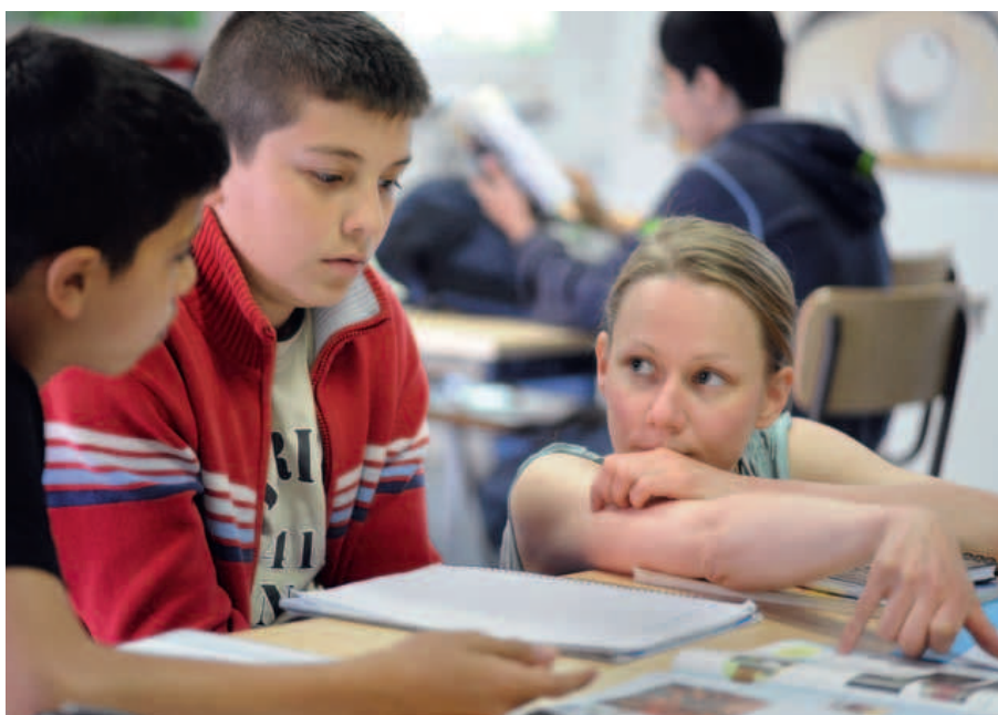
DaZ ist ein Muss: Schüler und Lehrende beim Förderunterricht für Schüler mit Migrationshintergrund in Berlin.