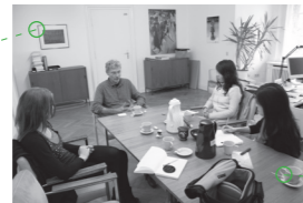
与专业人士的小组讨论, 戴姆勒博物馆 2009年10月7日, 柏林 Specialised group discussion with Representatives, Museen Dahlem 7 Oct 2009, Berlin