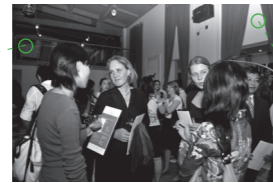
项目聚会, 方家胡同46号 2009年9月5日, 北京 Get Together Party, Fangjia Hutong 46 5 Sep 2009, Beijing