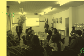
柏林旅游营销公司 2009年9月21日, 柏林 Berlin Tourism Marketing GmbH 21 Sep 2009, Berlin