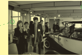
汽车城, 沃尔夫斯堡 2009年9月23日, 柏林 Autostadt GmbH, Wolfsburg 23 Sep 2009, Berlin