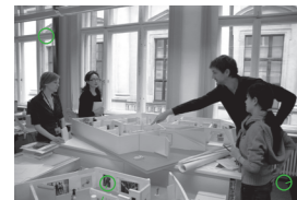
分组短期实习, 德国历史博物馆 2009年10月15日, 柏林 Internship in small group, Deutsches Historisches Museum 15 Oct 2009, Berlin