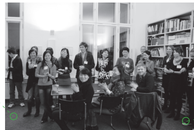
告别晚宴, B&S SIEBENHAAR出版公司 2009年10月16日, 柏林 Farewell Party, B&S SIEBENHAAR Verlag OHG 16 Oct 2009, Berlin