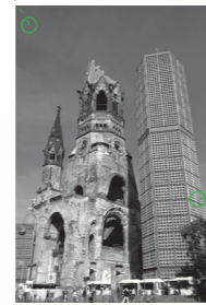
柏林城市游览, 柏林纪念大教堂 2009年9月19日, 柏林 City Tour in Berlin, Gedächtniskirche 19 Sep 2009, Berlin