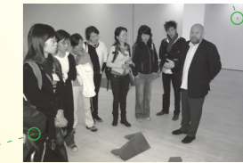
柏林北京Alexander Ochs画廊, 柏林画廊游 2009年9月26日, 柏林 Gallery Tour in Berlin, Alexander Ochs Galleries Berlin/Beijing 26 Sep 2009, Berlin