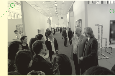
柏林艺术论坛 2009年9月25日, 柏林 art forum berlin 25 Sep 2009, Berlin