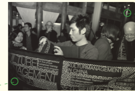
学员联盟聚会, 有璟阁 2009年12月17日, 北京 Alumni Association Party, Le Quai 17 Dec 2009, Beijing