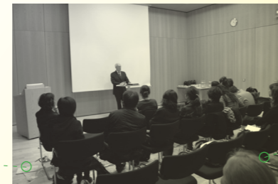
德国联邦外交部 2009年10月6日, 柏林 The Federal Foreign Office 6 Oct 2009, Berlin