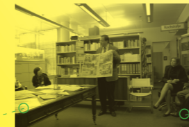
柏林Axel Springer出版公司 2009年10月5日, 柏林 Axel Springer Verlag AG Berlin 5 Oct 2009, Berlin