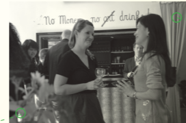
欢迎酒会, Starke基金会(非盈利艺术基金会) 2009年9月20日, 柏林 Welcome Reception, Stiftung Starke -gemeinnützige Kunststiftung 20 Sep 2009, Berlin