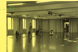
Radialsystem剧场 2009年10月1日, 柏林 Radialsystem V GmbH 1 Oct 2009, Berlin