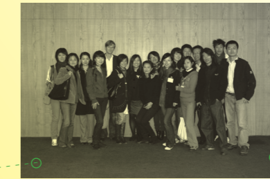
柏林节日演出 2009年9月29日, 柏林 Berliner Festspiele 29 Sep 2009, Berlin